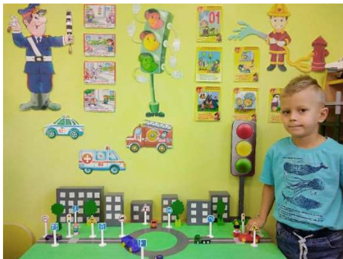
Нетрадиционное родительское собрание «С Лего легче все уметь, с Лего легче поумнеть»